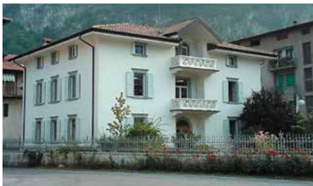
^ La bella Sede del Consorzio Elettrico di Storo.

Siamo a novembre ed è tempo di bilanci. Anche nel 2017, ed è il terzo anno consecutivo, avremo una produzione idroelettrica molto inferiore alla media pluriennale, produrremo solo poco di più del minimo storico realizzato nel 2015 e auguriamoci di non aver iniziato la serie dei sette anni magri della Bibbia. Tuttavia i risultati economici saranno molto buoni; prevediamo oltre un milione di utili, il 20% in più dell'anno scorso.